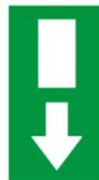
PERCORSO/USCITA DI EMERGENZA